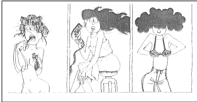
Vamos a ver... Edi-6